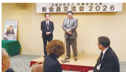
紹介者・新会員自己PR