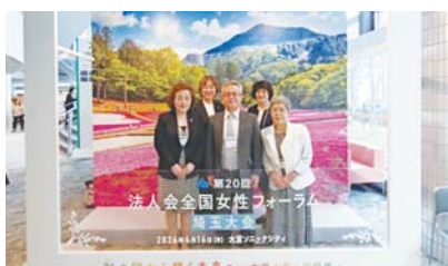
ソニックシティ (式典会場)

大会終了翌日には、秋田県まで足を延ばし満開の桜を観賞、日常の仕事から束の間解放され、明日への活力を養った。