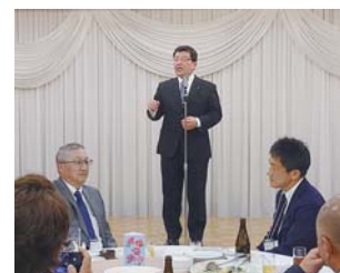
伊藤現役顧問中締め