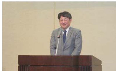
山本大同生命保険(株)北海道支社長中締め

※「令和7年度事業報告並びに決算報告」、「令和8年度事業計画並びに予算」、「役員名簿」については 当会ホームページ https://www.sapporo-kita.or.jp の「情報公開」に掲載予定