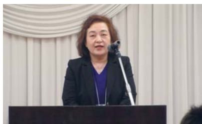
犬嶋女性部会長祝杯