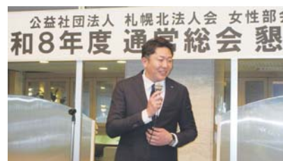
牧野青年部会長祝杯