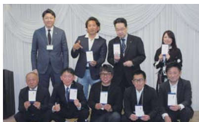
卒業される部会員へ記念品贈呈