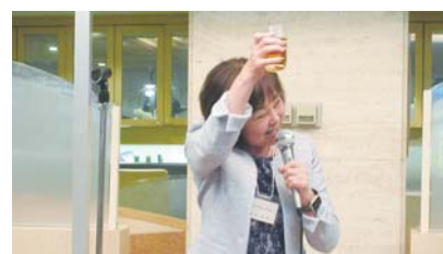
相田副部会長中締め