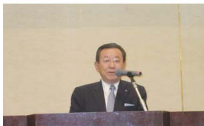
宮永副会長主催者挨拶