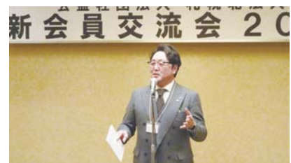
成田副会長中締め